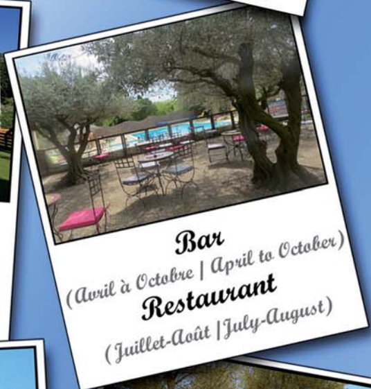
Bar (Avril à Octobre | April to October) Restaurant (Juillet-Août | July-August)