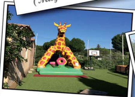
Aire de Jeux Enfants & Mini-golf Kids Playground & Mini-golf