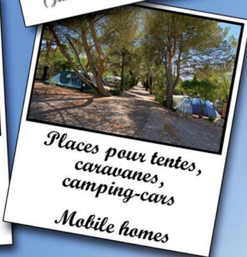
Places pour tentes, caravanes, camping-cars Mobile homes