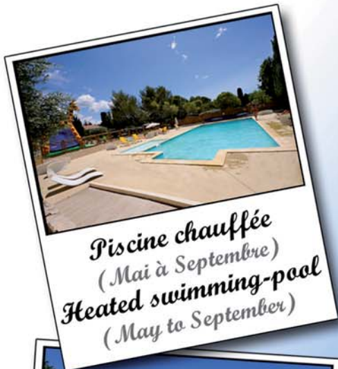
Piscine chauffée (Mai à Septembre) Heated swimming-pool (May to September)