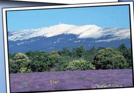
Des balades à découvrir Hiking and Biking tours to discover